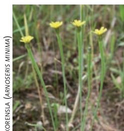
KORENSLA (ARNOSEERIS MINIMA)