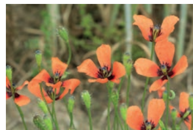
RUIGE KLAPROOS (PAPAVER ARGEMONE)